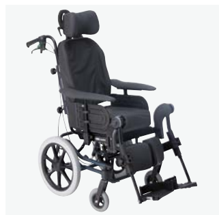
Rea Azalea Minor

Mismas características que la Rea Azalea estándar pero en versión ruedas traseras 16".