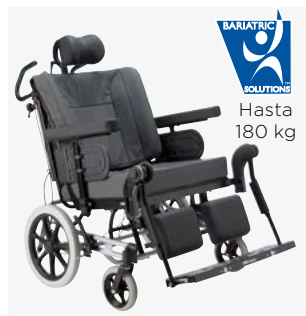
Rea Azalea Max

Silla de posicionamiento especialmente diseñada para usuarios de peso elevado (hasta 180 kg).