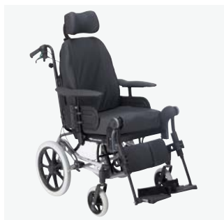
Rea Azalea Assist

Mismas características que la Rea Azalea estándar pero en versión ruedas traseras 16".