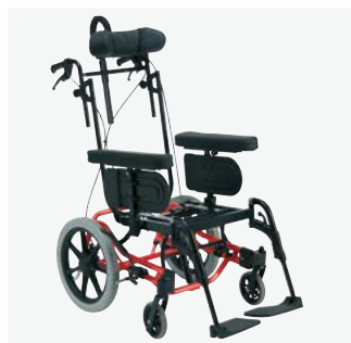
Rea Azalea Base

Silla de posicionamiento especialmente diseñada para usuarios altos (a partir de 185 cm). Altura de asiento: 50 cm. profundidad de asiento ajustable 48-55 cm. Incluye extensión de chasis como estándar. • Ruedas traseras 16", 22", 24".