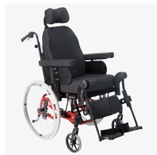
Rea Azalea Alta

Silla de posicionamiento especialmente diseñada para usuarios altos (a partir de 185 cm). Altura de asiento: 50 cm. profundidad de asiento ajustable 48-55 cm. Incluye extensión de chasis como estándar. • Ruedas traseras 16", 22", 24".