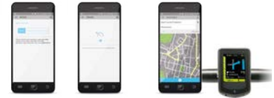
Pack Mobility Plus