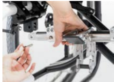
Kit de fijación (montado en la silla)