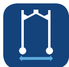
Anchura de la base ▼