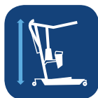
Máx. Altura (con brazo corto/extendido) ▼