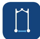
Ancho interno con patas cerradas ▼