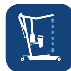
Velocidad de elevación ▼