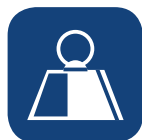
Peso total producto ▼