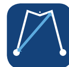
Radio de giro ▼