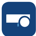
Distancia al suelo ▼