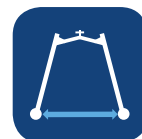
Ancho interno con patas abiertas ▼