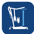
Rango de elevación (con brazo corto/extendido) ▼