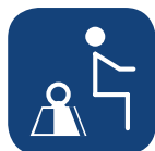
Peso seguro SWL ▼

Todas las medidas se han realizado con ruedas de 100mm, placa de bipedestación inclinada 5° y un usuario de 80kg. Todas las medidas han sido tomadas con una tolerancia de + 3%.