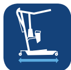
Longitud de la base ▼