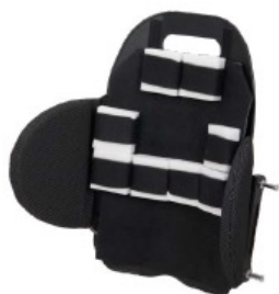
Kit de Posicionamiento Matrx Shape