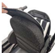
Inserto SHAPE colocado debajo del cojín HUG de StaminaFibre® del respaldo Matrx MAC