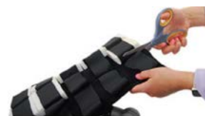
Configuración a medida