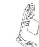
1562005 / 1562006 / 1562007