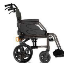
Action2 Lite transit