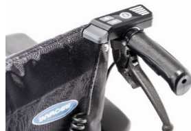
Unidad de mando