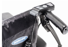
Unidad de mando