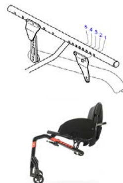
DKA1500 a DKA1540