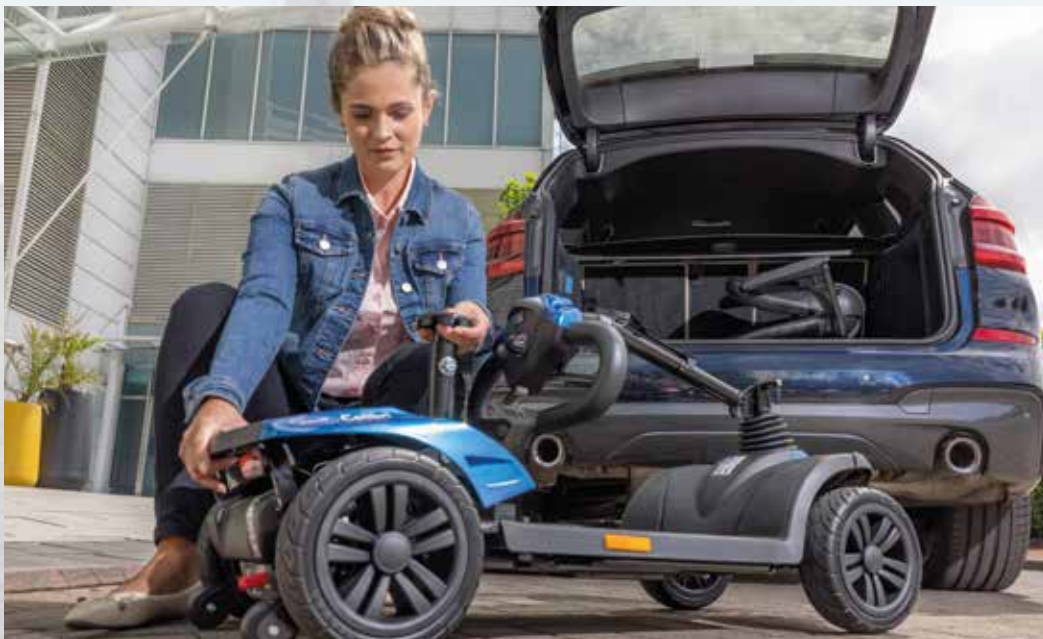
Fácil de transportar gracias al sistema Litelock™