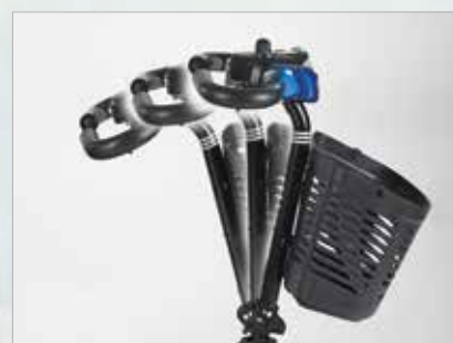
Manillar ajustable para mejorar la posición de conducción