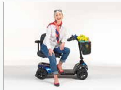
Asiento giratorio para transferencias más fáciles