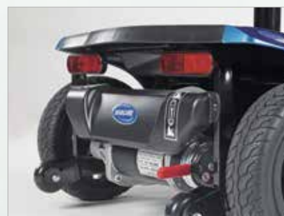
Iluminación de alta calidad