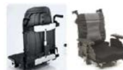
Unidad de asiento Modulite