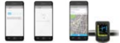
Pack Mobility Plus