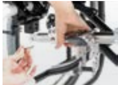
Kit de fijación (montado en la silla)