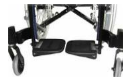
kit estabilizador : ESTÁNDAR con anchos de 208 hasta 280 mm